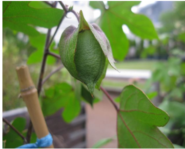
↑ 今にもはちきれそうな綿の実。