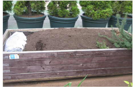
↑ まるで誰かが就寝中のよう。今度はどんな野菜ができるのかな。