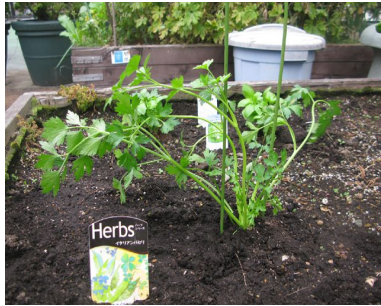
↑ イタリアンパセリ。みずみずしいですね。