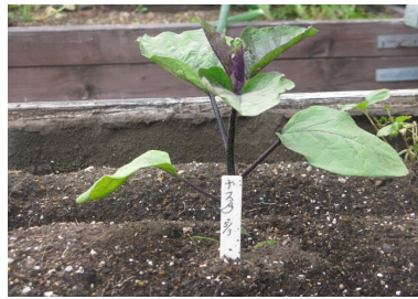
キュウリくん。 ぴんと胸はってるね。