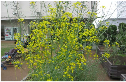
ひまわり農園の菜の花。 この種は被災地に送る菜の花の種 の「お母さん」になるんだね。

みなさん、こんにちは。農作業はいかがですか。さっそく、農園みまわりさんのサラダ農園さんから報告が届きました。そして通い箱のファイルに農作業レポートも！ありがとうございます！私も5月6日の午後、農園について「タピラス農園」に種まきをしました。するとひとつひとつの農園をていねいにみている方や、葉っぱが風にゆれるのを見て笑っている小さな女の子がいました。田中農園にはきぬさやが実っていました。先に花をつけたまま。農園の景色はのどかでかわいいです。