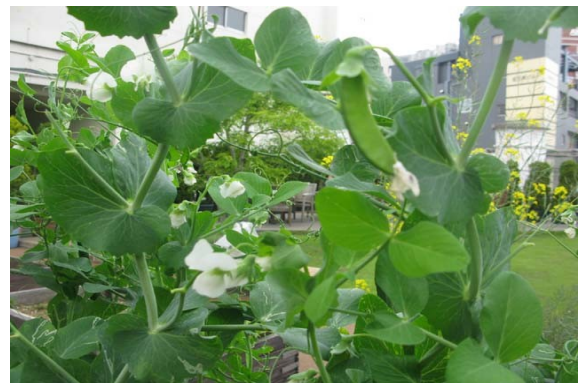
生まれてたてのきぬさやのみずみずしいこと。 そして野菜の花は、シンプルできれい。

たたみ一畳農園はHANDINHAND (アジアの子どもたちの秋の収穫祭)活動の一つ。 都会の子どもたちが自然と五感で親しめる場として、 アトレ目黒さんの協力を得て2004年から展開中。