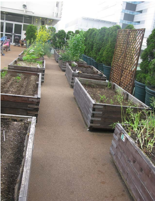
5月初めの農園の景色。 季節とともにどんなふうになるのかな。

たたみ一畳農園はHANDINHAND (アジアの子どもたちの秋の収穫祭)活動の一つ。 都会の子どもたちが自然と五感で親しめる場として、 アトレ目黒さんの協力を得て2004年から展開中。