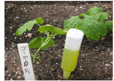
ゴーヤ殿。今年は大人気。 いくつ実がなるかな。